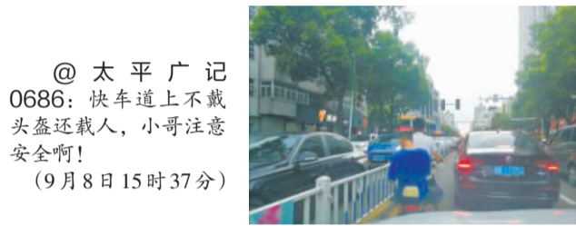
@太平广记 0686：快车道上不戴头盔还载人，小哥注意安全啊！