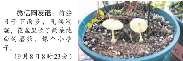
微信网友诺：前些日子下雨多，气候潮湿，花盆里长了两朵纯白的蘑菇，像个小亭子。