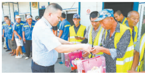
昨天，胜山镇慈善分会购买了月饼慰问该镇的一线环卫工人。