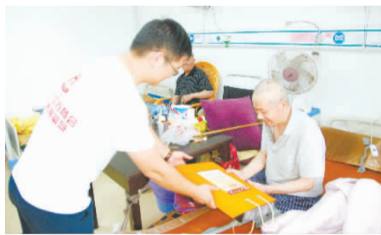
日前，慈溪市江苏商会一行来到阳明养老服务中心，为该中心83位老人送去月饼、饮料、油米等慰问品，回报自己创业的新故乡。