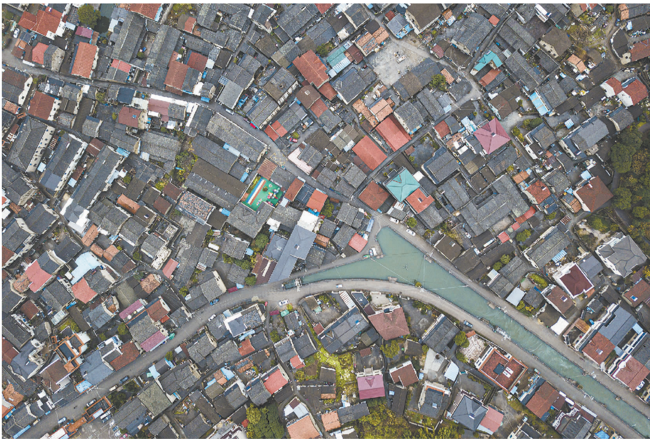
空中俯瞰邱王老街。