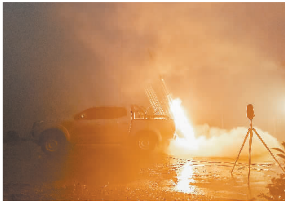
人工增雨现场发射火箭弹。

从昨天开始，阳光早早现身，我市开启了近一周的连晴天气。湿冷不再，晴冷上线，今明两天的最低气温有可能会创下新低。不过，白天气温提升速度不快，本周最高气温保持在10℃以上，找个避风的地方晒晒太阳还是挺舒服的。空闲之余，也很适合到外面走一走。