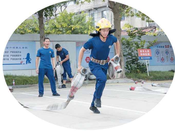
图为前天早上，消防员正在进行一人三带操训练。

在日常饮食方面，大队食堂针对季节特点合理定制食谱，以新鲜瓜果、蔬菜、瘦肉、豆制品等温软、易消化、