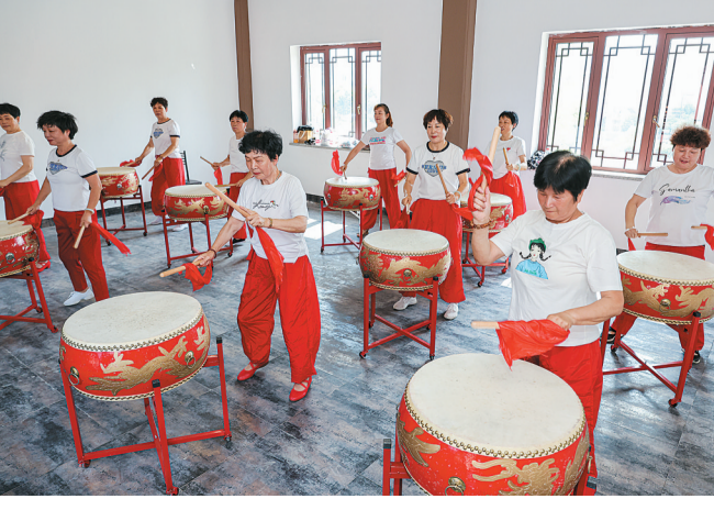
日前，龙山镇西门外村文化宫各活动室热闹非凡，唱戏、下棋、练鼓……村民们玩得不亦乐乎，成了酷暑里的一道风景。